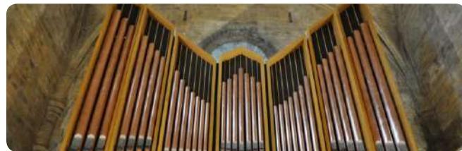
CONCIERTOS DE ÓRGANO PROGRAMA "LEYRE, ESPACIO MUSICAL"

VISITAS TURÍSTICAS (todo el año excepto el 24 de diciembre por la tarde 25 de diciembre y el 1 y 6 de enero)